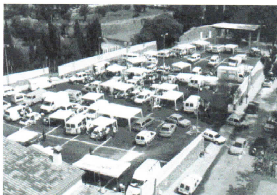
Aparcamiento Municipal Can Miró (Puerto) Parque de Verificaciones

EL HORARIO DE VERIFICACIONES DE PUBLICARÁ EN ANEXO APARTE UNA VEZ PUBLICADA LA LISTA DE INSCRITOS